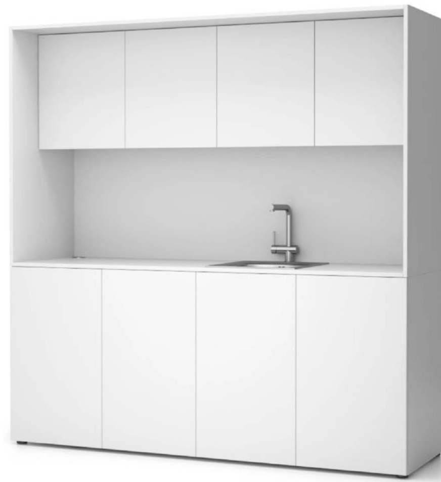
TRUHLÁŘSKÝ VÝROBEK T33