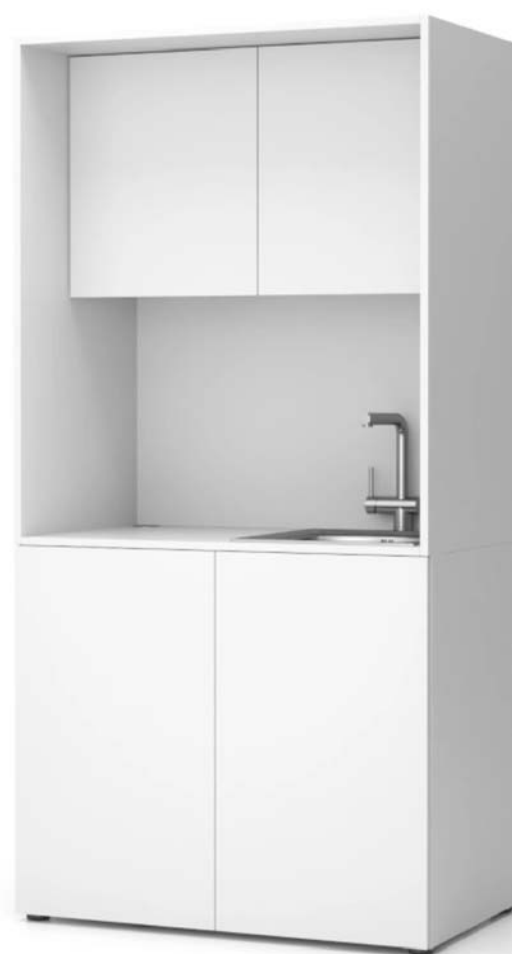
TRUHLÁŘSKÝ VÝROBEK T34